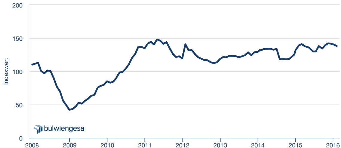
Immobilienklima bis Februar 2016

Die 98. Monatsumfrage des Deutsche Hypo Immobilienkonjunktur-Index zeigt, dass die Zukunftserwartungen der befragten Immobilienexperten lange nicht mehr so positiv sind wie über weite Strecken des Jahres 2015. Im Februar 2016 sinkt das Immobilienklima zum dritten Mal in Folge. Mit einer Abnahme von 1,5 Prozent auf aktuell 138,1 Zählerpunkte nimmt die Negativentwicklung sogar Beschleunigung auf (Dezember 2015: -0,4). Die Eintrübung zum Jahreswechsel könnte also vom heutigen Standpunkt aus nicht als Wachstumspause, sondern als erstes Anzeichen für eine bevorstehende Trendumkehr verstanden werden. Der Rückgang resultiert zu annähernd gleichen Teilen aus dem Sinken der beiden Teilindikatoren Investmentklima und Ertragsklima. Erstgenanntes liegt mit einem Minus von 1,1 Prozent derzeit bei 146,2 Zählerpunkten und das Ertragsklima bei 130,2 Zählerpunkten (-2,0 %).