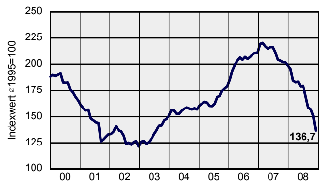
Immobilienkonjunktur 01/2000 bis 11/2008

Ein baldiger Stopp der Abwärtstendenz ist nicht erkennbar, obwohl der deutsche Immobilienmarkt im Unterschied zu einigen Auslandsmärkten als im Kern gesund angesehen wird. Sobald nachhaltige Stabilisierungstrends erkennbar sind, wird mit einer vergleichsweise hohen Marktattraktivität des deutschen Immobilienmarkts gerechnet. Die entsprechenden Markteffekte werden jedoch noch bis zu einer Markterholung auf sich warten lassen.